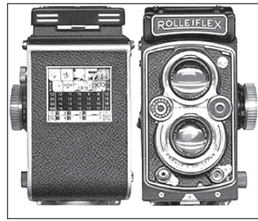
Máy ảnh chụp bằng phim tương chừng như bị quên lãng và dường như đang trở thành sản phẩm hiếm hoi trong thời đại ngày nay.

LNM: Thưa anh Huân, theo cách suy nghĩ của riêng tôi thì máy ảnh chỉ là một phương tiện! Trong một thời đại kỹ thuật số có tốc độ phát triển tới chóng mặt, nếu chúng ta còn có thời gian để bận rộn cho việc chụp bằng phim... tráng phim trong hóa chất... theo quá trình của nhiếp ảnh cổ điển thì cũng nên lắm chứ