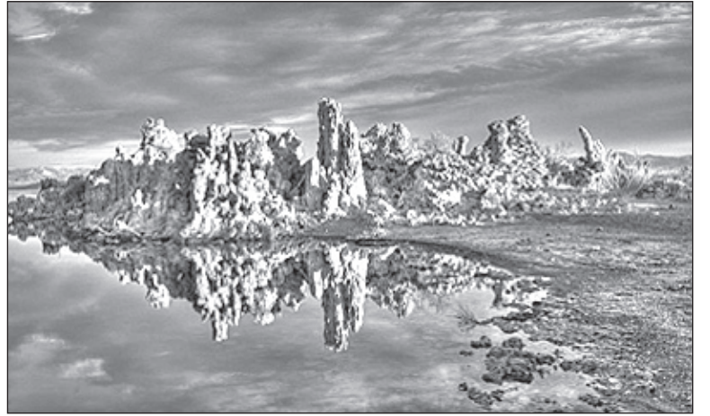
Mono Lake, California.

Nhiếp ảnh gia LTV ngoài những tác phẩm chuẩn, ông còn những sáng tác đầy cá tính. Tôi thích thú khi xem tác phẩm: Monument Valley trang 12, tượng đài, đền miếu thành quách... là của quá khứ, của lịch sử, công trình của trăm năm, ít ai còn nhớ, tất lẽ loi lạc lũng, nhưng ở đây tác phẩm Monument của LTV lại vững chắc ấm áp nhờ tác giả lợi dụng vòm cây (Juniper) làm tiền cảnh đóng khung chủ đề, điểm muốn nhấn mạnh. Chủ đề tuy nằm ngay tâm điểm của ảnh mà không hề chõi, nghĩa là không phạm luật bố cục, trái lại còn bắt mắt hơn. Tác phẩm Teardrop Arch trang kế bên, dẫn người xem trong nháy mắt vụt tụt về miền xa một cách bất ngờ. Tác phẩm Cathedral Rock trang 50 là một ảnh phong cảnh khá lạ. Bầu trời tím, dải mây ngang làm nền cho chủ đề Cathedral Rock màu đỏ sậm, đến rừng cây mịn lá, dòng nước lung linh bóng "giáo đường" nhẹ nhẹ, và tiền cảnh là bãi đá cuội sáng rực. Cảnh vật từ chân đứng của người chụp tới tận chân trời tím đều rõ nét. Bãi đá cuội là đề của tác phẩm, trên đó lần lượt các yếu tố nội dung được sắp xếp từ gần đến xa, sắc độ màu, mạnh yếu từng phần không gian hài hòa hợp lý, không lẫn át nhau, mục đích tối hậu là làm nổi bật Cathedral. Tôi liên tưởng giây phút bấm máy của tác giả: Giây phút giao hòa