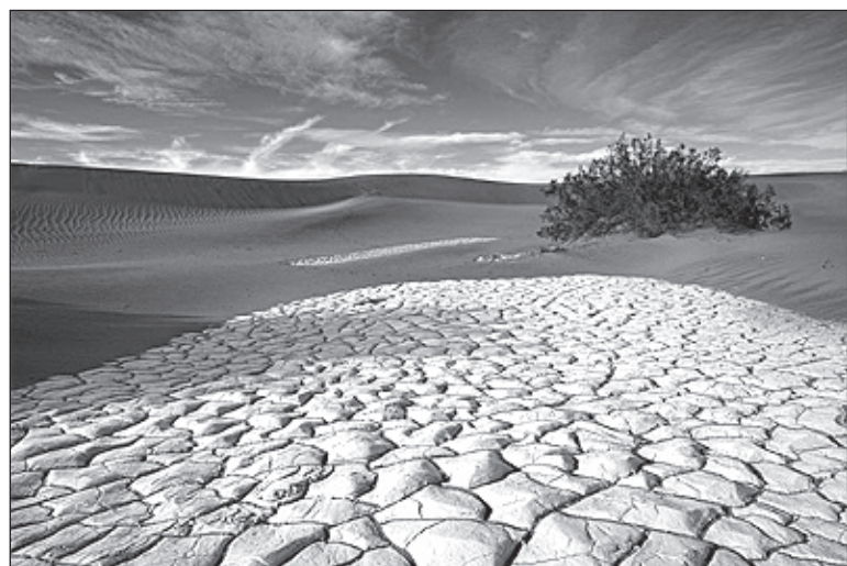
Sand Dunes, Death Valley National Park, California.

Thưa anh, tôi bắt đầu thai nghén cho tác phẩm này từ 1994. Khó khăn thì nhiều, nhưng lòng đam mê của tôi cộng với sự thúc đẩy của hiền thê, tôi đã vượt qua nhiều chướng đường tưởng không qua nổi. Trước hết là hình ảnh của My Homelands, hình ảnh Quê Hương thì phải cả hai bên bờ đại dương chứ không chỉ riêng một phía. Anh ở Mỹ tương đối nhiều, ảnh quê nhà thì muốn vẽ, vì do công ăn việc làm, thời gian không cho phép, đi xa lâu ngày nay thứ gì cũng lạ, lạ cả đường đi nẻo về nên không sao có được những hình ảnh mình mong muốn. Một cái khó nữa là việc in ấn, anh chắc kinh nghiệm nhiều trong việc này. Một cuốn sách ảnh không thể in như một cuốn tiểu thuyết. Tôi lại muốn cuốn sách có dáng dấp một đứa con tinh thần sinh tại nơi đây, nghĩa là đứa con thực sự đi vào "dòng chính". Nên, khi đủ ảnh (khoảng 200) cho sách, tôi phải qua tận Hong Kong ăn chức nằm chờ suốt hai tuần lễ lo việc in ấn.