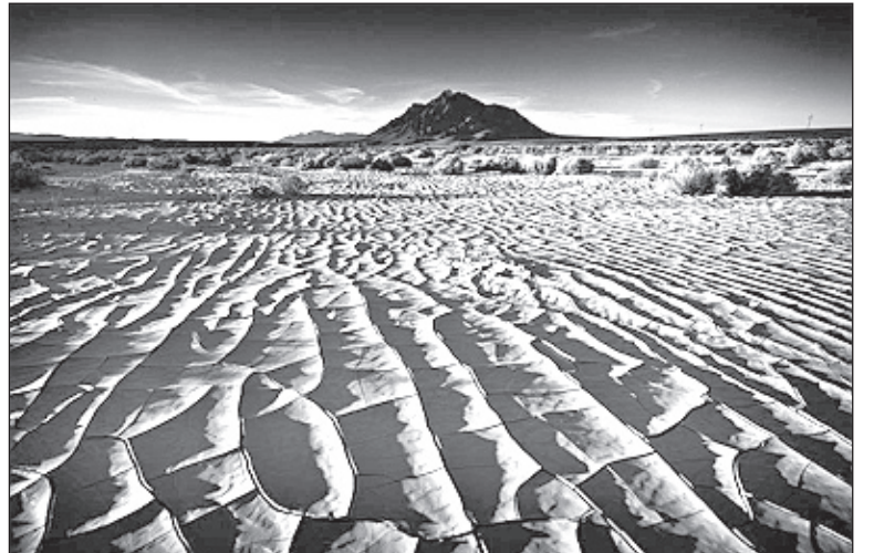
Death Valley National Park, California.

Dù khó khăn nhưng đã một phần đời sống nơi chôn nhau cắt rốn nên tác giả không thể thiếu hình ảnh đất mẹ trong tác phẩm đầu tay của mình. Ông đã về phố cổ Hội An ghi hình ảnh thuyền bè, bến chợ trên sông Hoài, sinh hoạt làng gốm cổ truyền, nghề làm lồng đèn... Hay về miền Tây ngồi thuyền vào sông rạch để có ảnh chiếc xuồng đưa khách qua rừng dừa nước, màu sắc tươi vui hiền hòa hoặc cảnh trí hùng vĩ trên